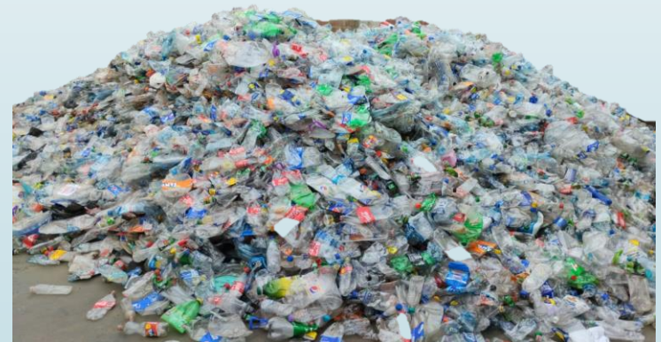
PET A GRANEL