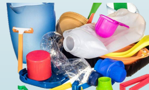
OBJETOS DE PLASTICO