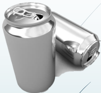
LATAS DE ALUMINIO