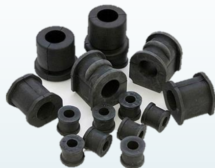
JEBES O CAUCHO